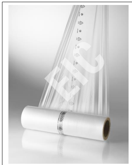
Présentation en bobine