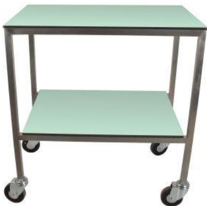
Table à instruments

Réalisé en acier inox 18/10 Marche antidérapante pointe diamant 1 marche 300 x 340 x Ht210 mm 2 marches 430 x 300 x Ht 420 mm 3 marches 430 x 300 x Ht 590 mm